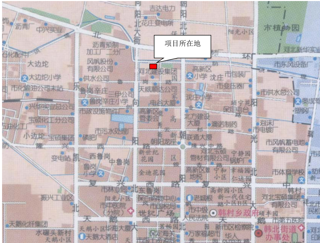
图 1 保定市明鉴焊接工程检测有限公司地理位置图