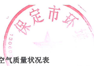
2022年1-2月保定市开发区空气质量状况表