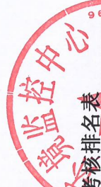
2022年1-8月份保定市开发区空气站考核排名表