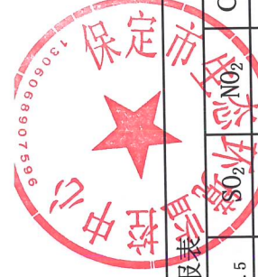
2022年7月乡镇站月报表