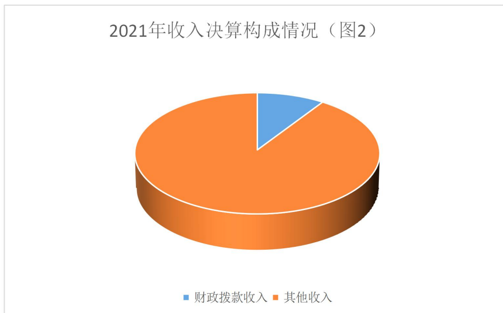
2021年收入决算构成情况（图2）